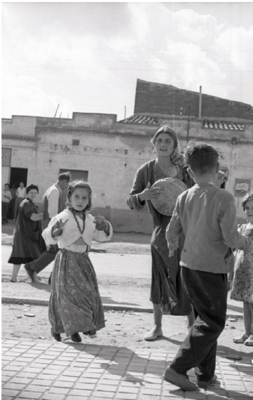
Uns nens i una dona d'ètnia gitana ballant en un carrer del barri de Ca n'Oriac. Sabadell, 1958.

L'ajuntament democràtic va iniciar la dignificació de les barriades de Sabadell.