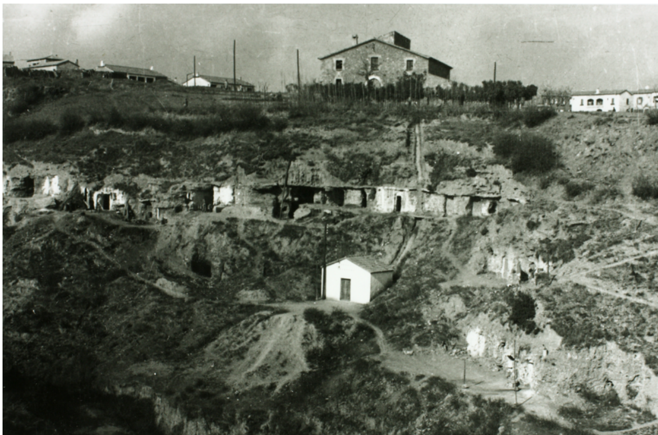
Masia i coves de Sant Oleguer. Sabadell, dècada de 1950.