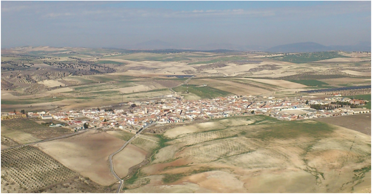
Vista del poble de Pedro Martínez (Granada). Març del 2012.

Però també es van produir canvis en els comportaments socials, molt significatius en les dones, sobretot en les noies, que es van involucrar en la societat i en la vida política del poble. N'és un exemple la creació de l'Asociación de Mujeres Antifascistas.