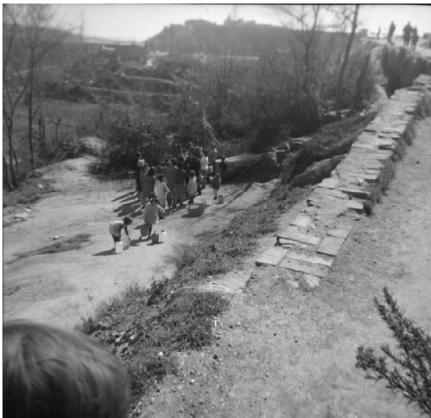
Dones anant a buscar aigua al riu Ripoll, sota la masia de Can Puiggener. Sabadell, 1968.

sense autorització. La particularitat d'aquells permisos era la suposada celeritat en la concessió de la sol·licitud i que les despeses dels drets d'obres gaudien d'un 40 % de descompte respecte de la resta de permisos d'obres.