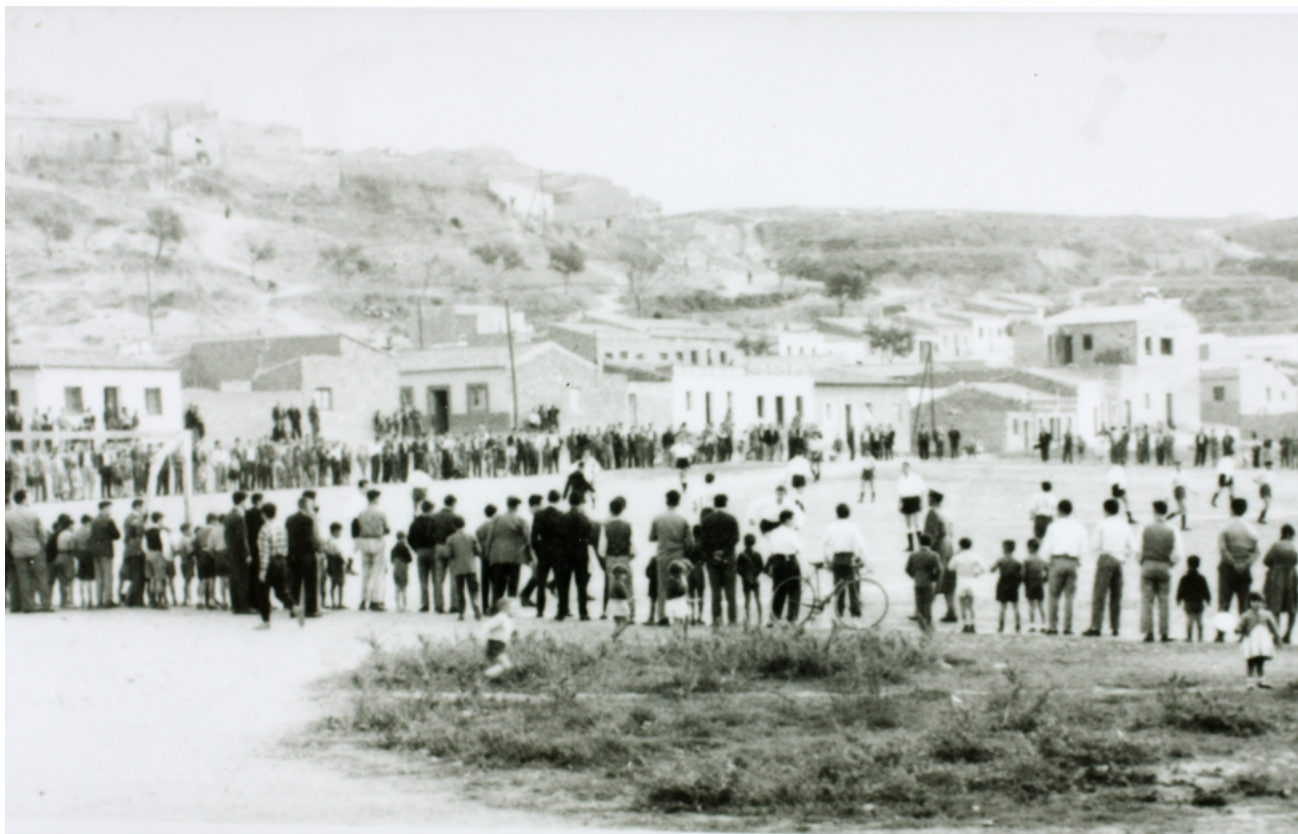
Partit de futbol al barri de Torre-romeu. Sabadell. 1958.

dies de pluja tenien més l'aspecte de torrents que no pas de camins. Alguns esglaons malfets amb fustes i totxos salvaven els desnivells abruptes. A banda i banda del que es va acabar convertint en el primer carrer del barri, el carrer Central, el veïnatge es va construir les petites cases i les voreres. A poc a poc, es van anar dibuixant altres carrers que no tenien ni nom i que aleshores s'anomenaven amb les lletres de l'abecedari.